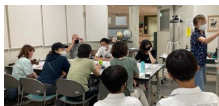
日本語講座 (職場体験の中学生も参加)