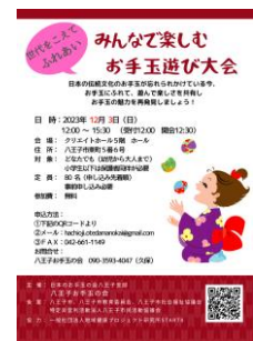
12月3日のイベントチラシ