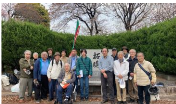
満蒙開拓碑と観桜

会場は、多くはクリエイイトホールやファルマ、アミダステーションなど、JR・京王八王子駅から徒歩圏内です。ぜひご参加ください。