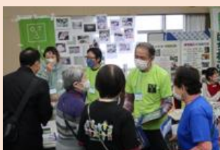
昨年の地域デビューパーティー

今後「協働」「共創」を推進し、中間支援組織としての活動を継続するために、理事に加え、多様な専門知識、スキル、価値観を持つ会員や市民に参画を募り、議論を通してチカラを十分に発揮できる仕組み作りに取り組みます。その時期が来ましたら改めて、会員のみならずの力をお借りし、ビジョンに向けて一緒に活動していけることを切に願います。