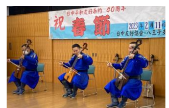
春節の会 馬頭琴演奏