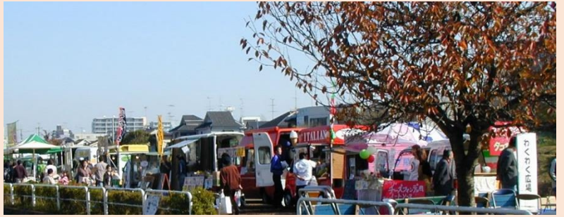
わくわく広場の様子