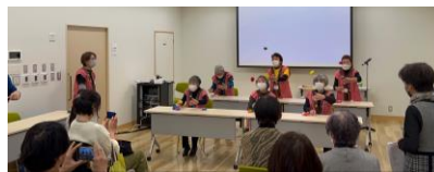
令和5年2月アクティブ市民塾の様子

〈温もいを届けたい手から心へ〉 お手玉の良いところ…安全でお金がかからない 瞬発力、判断力、集中力のアップが 脳の活性化&多世代交流につながります！