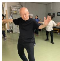
太極拳カフェ (太極拳とお茶会)