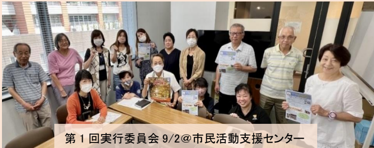
第1回実行委員会 9/2@市民活動支援センター

20以上の団体が、軽食やお菓子、地場野菜、竹パウダーや陶器、手作り品などの販売、箱庭や吹き矢、お手玉、環境クイズなど色々なワークショップを提供します。