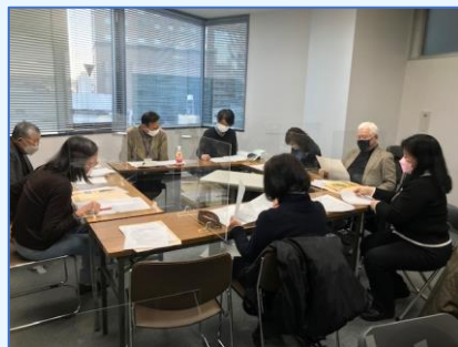
実行委員会:まん延防止等重点措置を見据えての開催形式など審議中