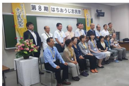
↑：市長挨拶と永沢先生講演 ←：入塾生記念撮影 ↓：懇親会の様子

この志民塾は今後原則毎週土曜日に行われ、来年2月11日の卒塾式をもって全15講座を終了いたします。