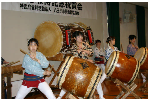
力強く演奏する太鼓塾・鳴神流雷神太鼓の皆さん

ご参会者の皆様、誠に有難うございました。これからもNPO法人八王子市民活動協議会の活動にご支援ご協力をよろしくお願い申し上げます。