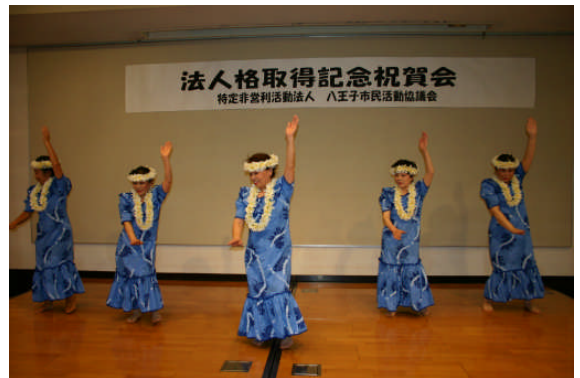
会場を和らげてくれた八王子フラダンス・モキハナの会の皆さん