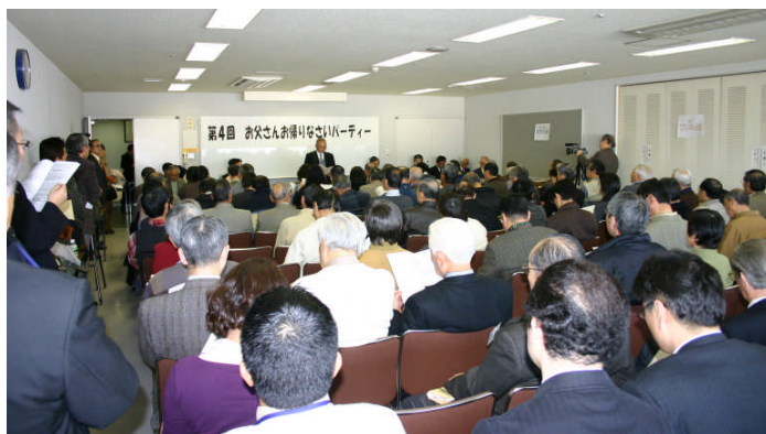
—前回開催した会場風景—