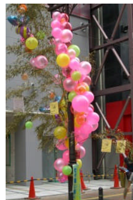
協議会が担当した七夕飾り！