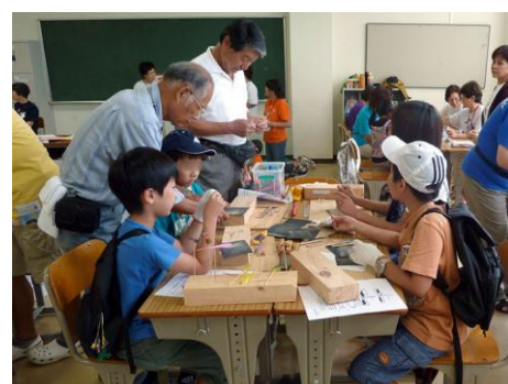
「八王子市レクリエーション協会」竹とんぼ作り