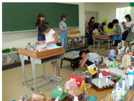
「カウンセリングまてりあ」箱庭遊び