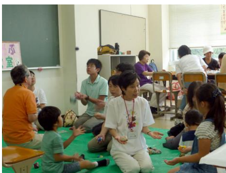
「八王子お手玉の会」伝承遊び