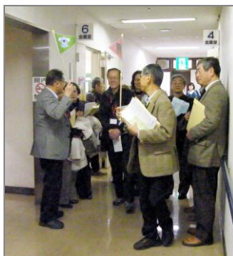
ツアーガイド風景