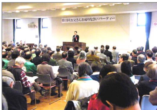
全体パーティ風景