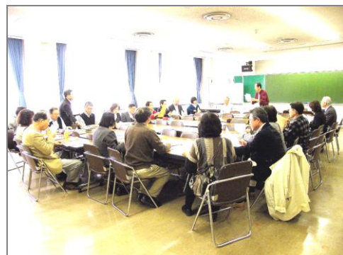
事前打ち合わせ風景